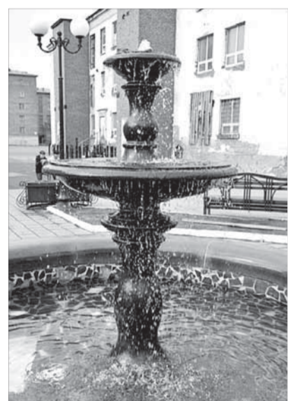
Фонтан заработал. Вернут ли шар?