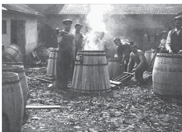
Бочки в Закарпатье когда-то были предметом, жизненно необходимым

Шли годы, и снова появилась возможность нашему дедушке работать на себя – в своем дворе он открыл настоящий бондарный цех. В селе его очень уважали и считали незаменимым человеком. Самое ценное: все инструменты,