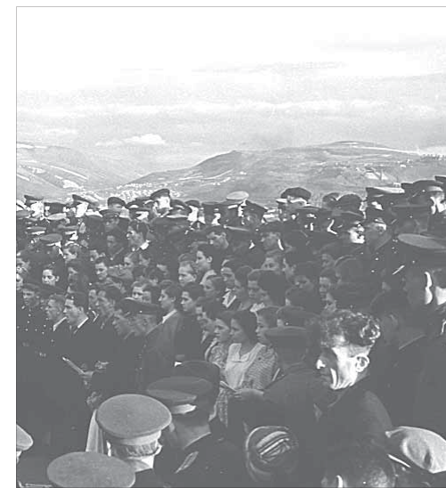
В первые годы Норильска-города было еще много горожан в форме

15 июля 1953 года Указом Президиума Верховного Совета РСФСР рабочему поселку Норильск присвоен статус города.