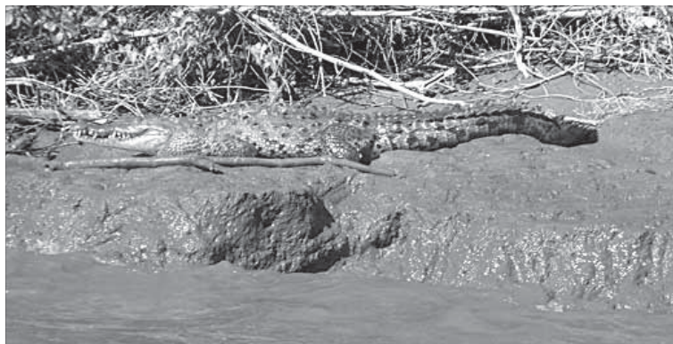
Крокодилам в местных водоемах приволье

...Море зеленой сельвы на сотни километров вокруг. Ветер колышет листву и волнами расходится до го-