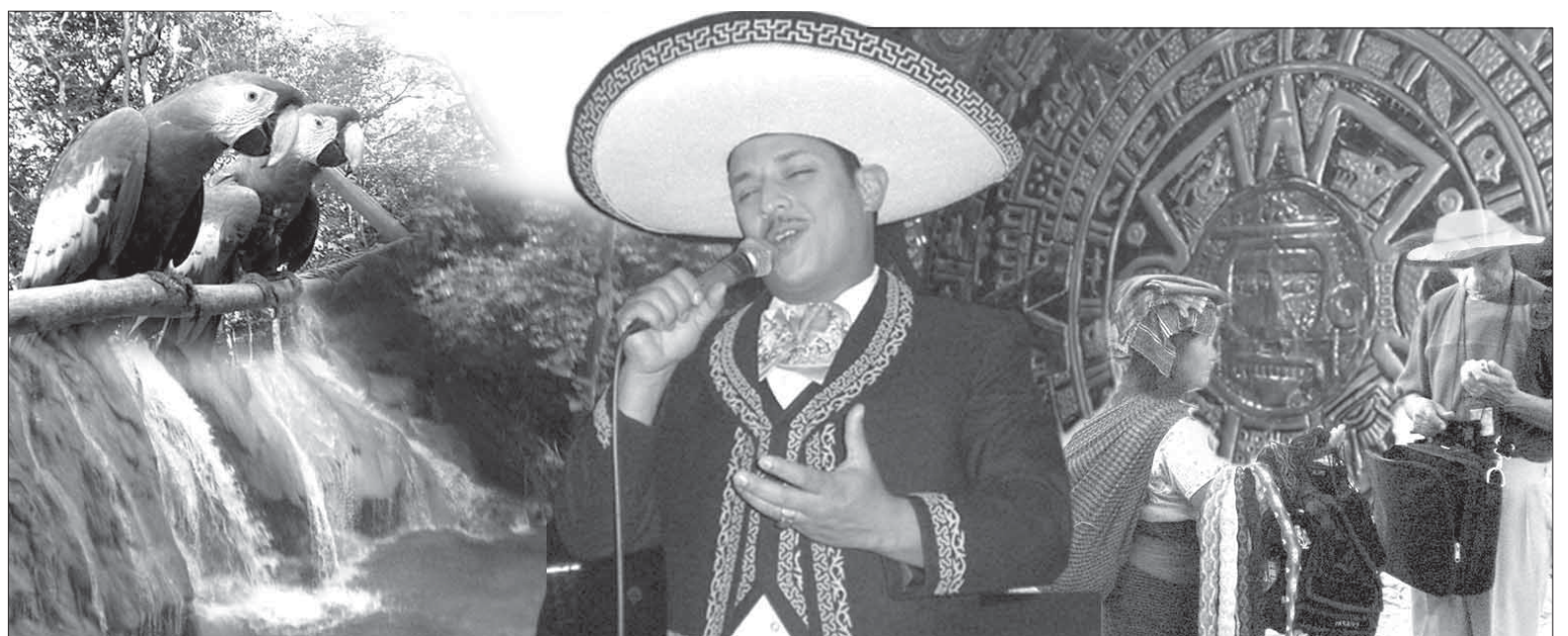
В странах Латинской Америки экзотика ожидает туристов на каждом шагу

Удивительным казалось все. Теотиуакан не зря называют "матерью городов мексиканских", колыбелью всех цивилизаций Центральной Америки. В период своего расцвета он превосходил размерами Рим. Однако историки до сих пор не знают имени ни одного из его правителей. Жители города не оставили никаких письменных свидетельств. Внезапно он погиб, но и причины его падения по-прежнему неясны. Такое же загадочное впечатление оставляют пирамиды. Если египетские были призваны увековечить память о фараоне, то пирамиды Мезоамерики имели другое назначение. Какое? Вопрос. При том что это даже и не пирамиды, а ряд усеченных конусов, расположенных друг над другом в виде ступеней. На них, в отличие от египетских, можно подняться.