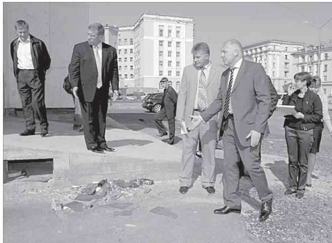
За город каждый в ответе

Не меньше поручений градоначальник дал владельцам магазина "Океан" на улице Лауреатов. До конца августа им предстоит оборудовать строительную площадку в соответствии с требованиями законодательных актов, убрать мусор, расставить урны, а главное – заасфальтировать прилегающую территорию и организовать на ней автомобильную стоянку.