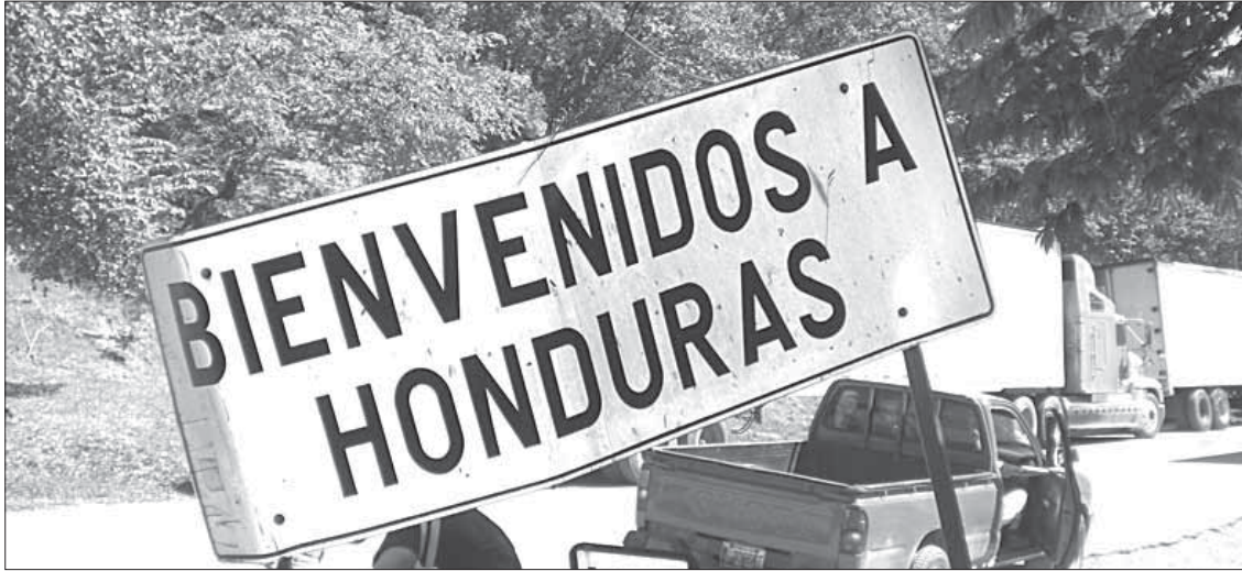
Покосившаяся табличка указывает, что здесь граница Гондураса